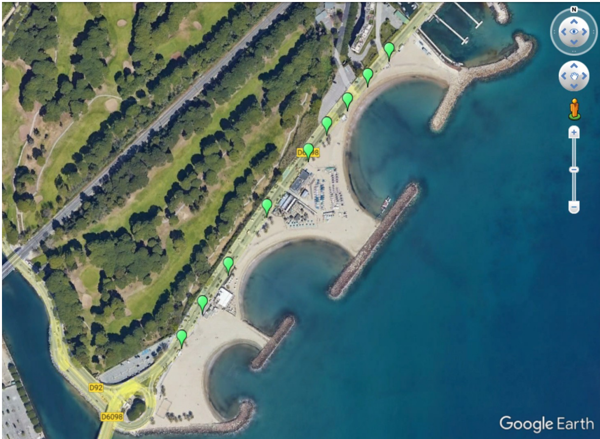
Localisation des points de rejets pluviaux sur les plages

Douches de plage se rejetant directement sur la plage.